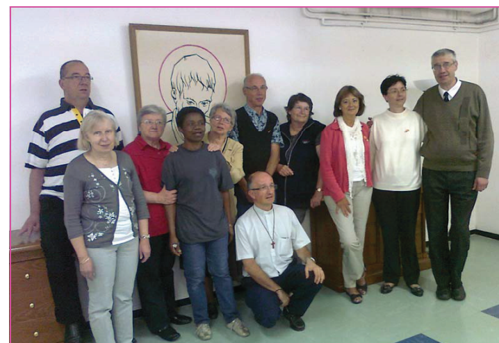
Entourant Rosabianca (It) et Amalia (Esp), en rouge, la Famille Camillienne Laïque de France