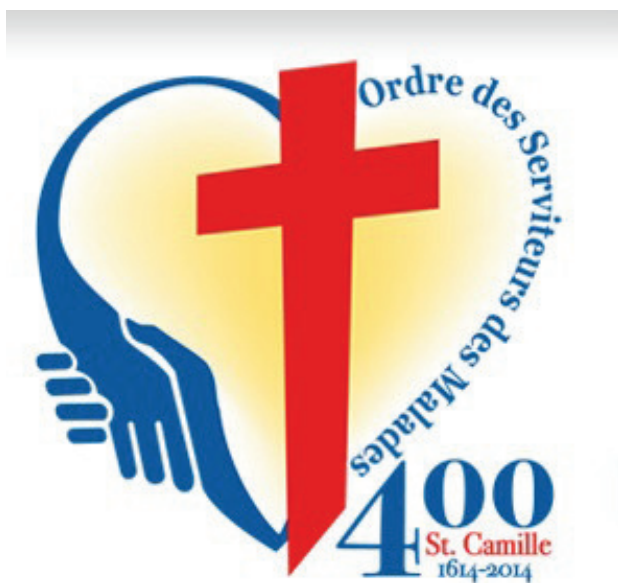
Logo du IVème centenaire de st Camille

Puis, les participants ont prévu le repas fraternel. Le Père Provincial a proposé un jeu pour permettre de bien communiquer, surtout avec les personnes que nous ne connaissions pas. Ensuite, nous avons poursuivi nos échanges pour les réalisations pour cette future commémoration. Après les vêpres, cette très bonne journée s'est terminée, avec le désir pour chacun qu'une autre rencontre de ce type puisse avoir lieu encore l'année prochaine. Merci à tous !